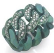
Rock Diamanti / Titanio Blu