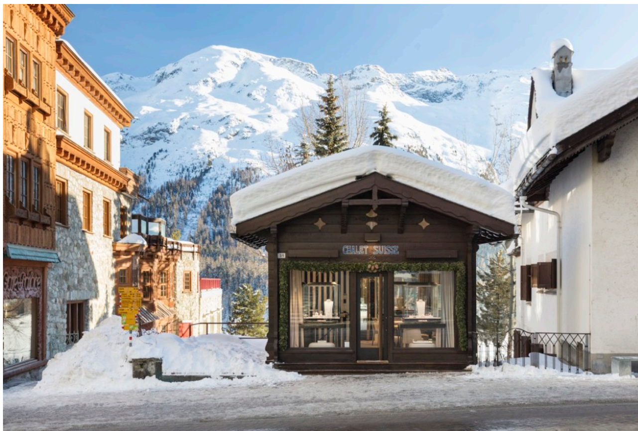
Gioielleria Remida Tornaghi via Serlas 31, St. Moritz

Arriva a St.Moritz in collaborazione con la gioielleria Remida Tornaghi dall'1 al 5 marzo 2022 Bite&Go, il progetto itinerante e internazionale ideato da Nicoletta Rusconi Art Projects per promuovere opere di artisti emergenti, mid-career ed established, uniche, inedite, di piccolo e medio formato e a prezzi accessibili.